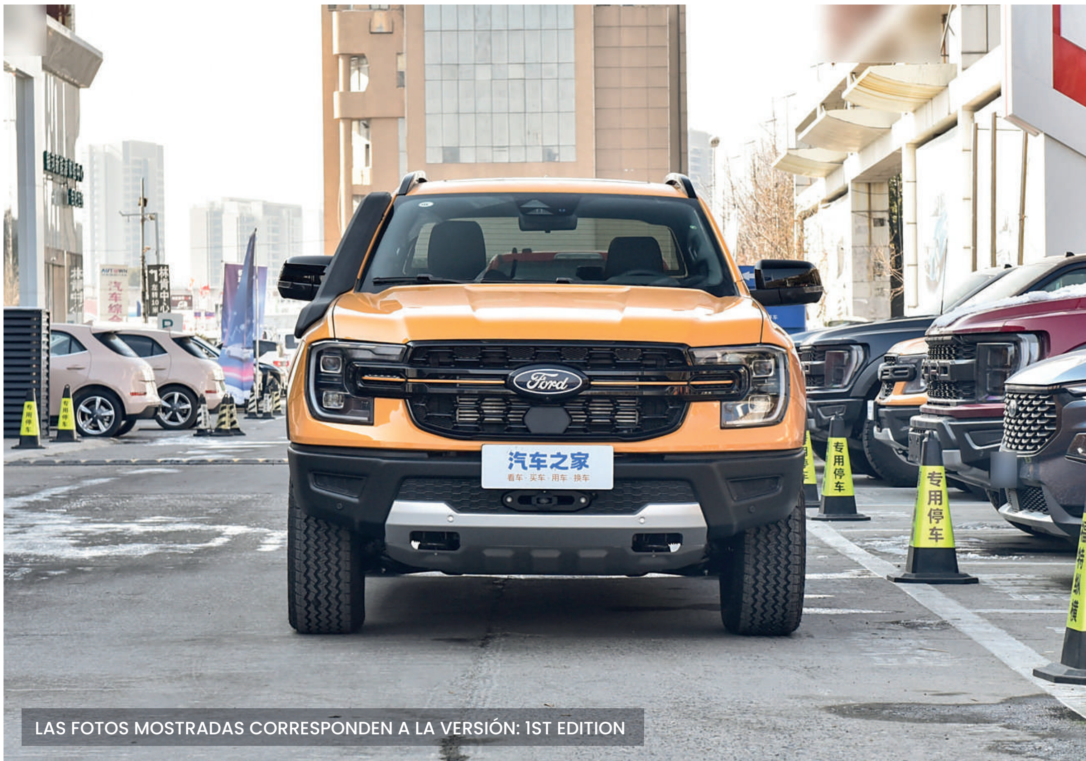
LAS FOTOS MOSTRADAS CORRESPONDEN A LA VERSIÓN: 1ST EDITION