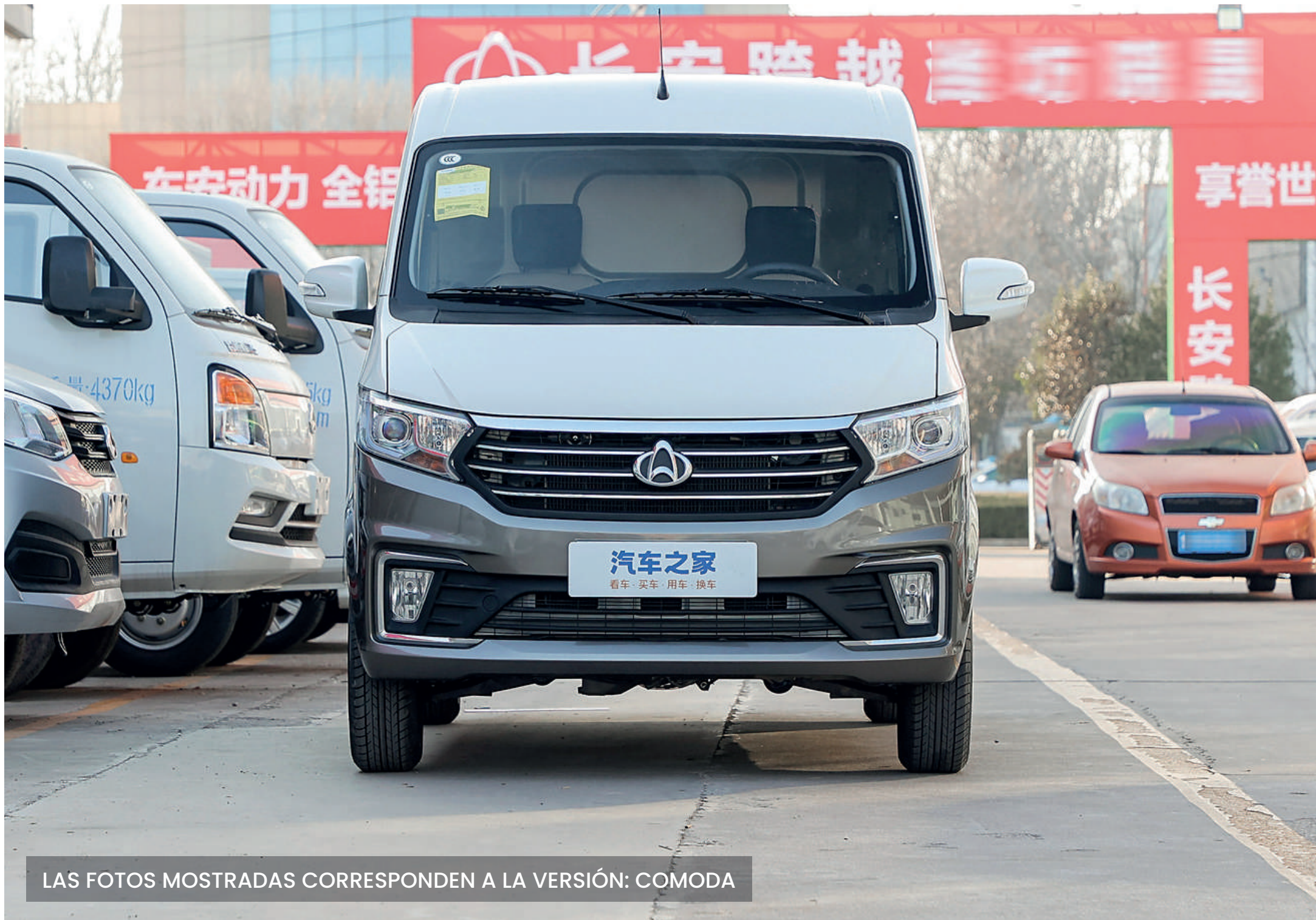
LAS FOTOS MOSTRADAS CORRESPONDEN A LA VERSIÓN: COMODA