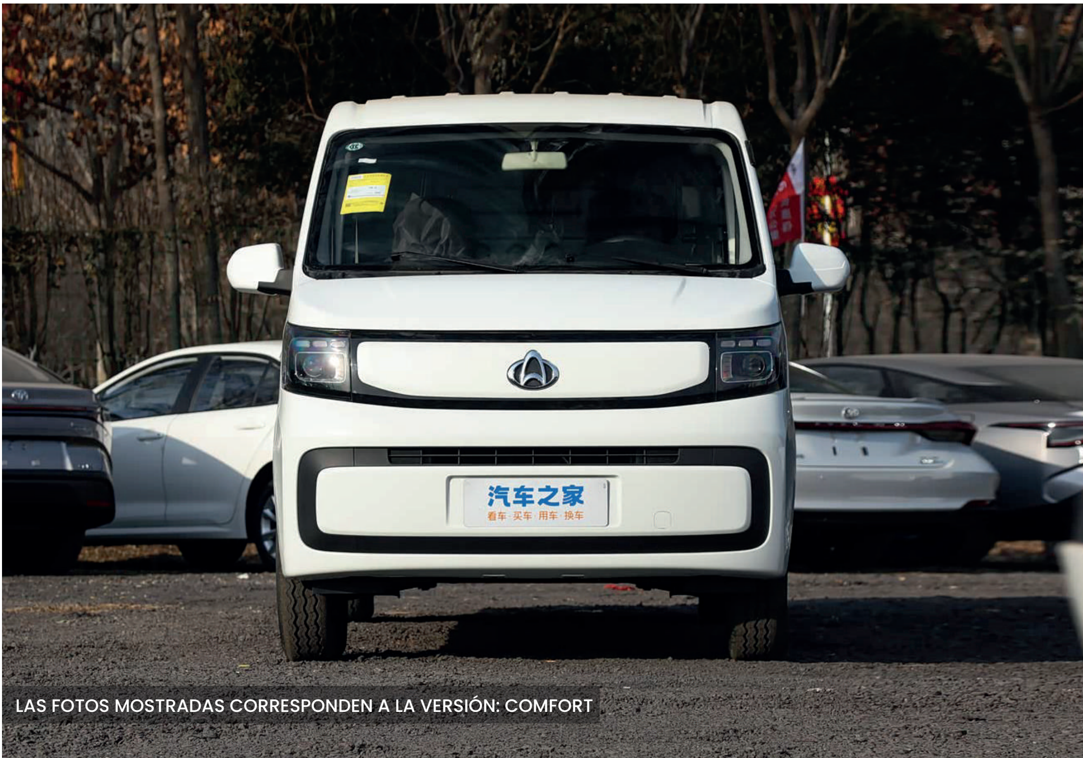
LAS FOTOS MOSTRADAS CORRESPONDEN A LA VERSIÓN: COMFORT