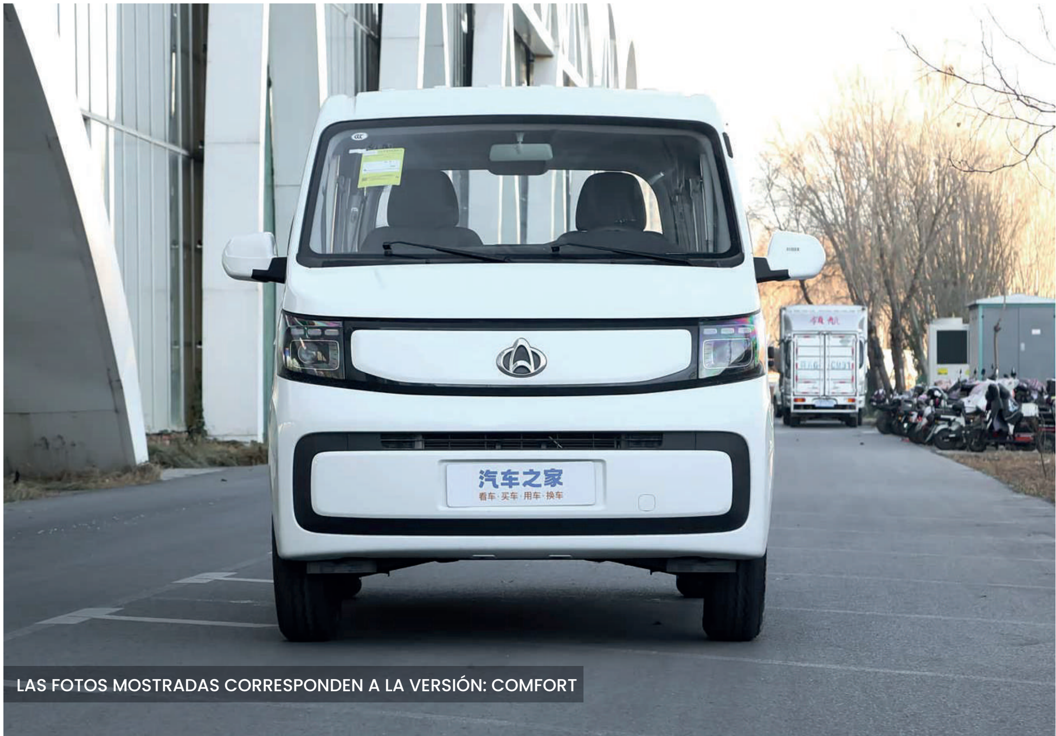
LAS FOTOS MOSTRADAS CORRESPONDEN A LA VERSIÓN: COMFORT