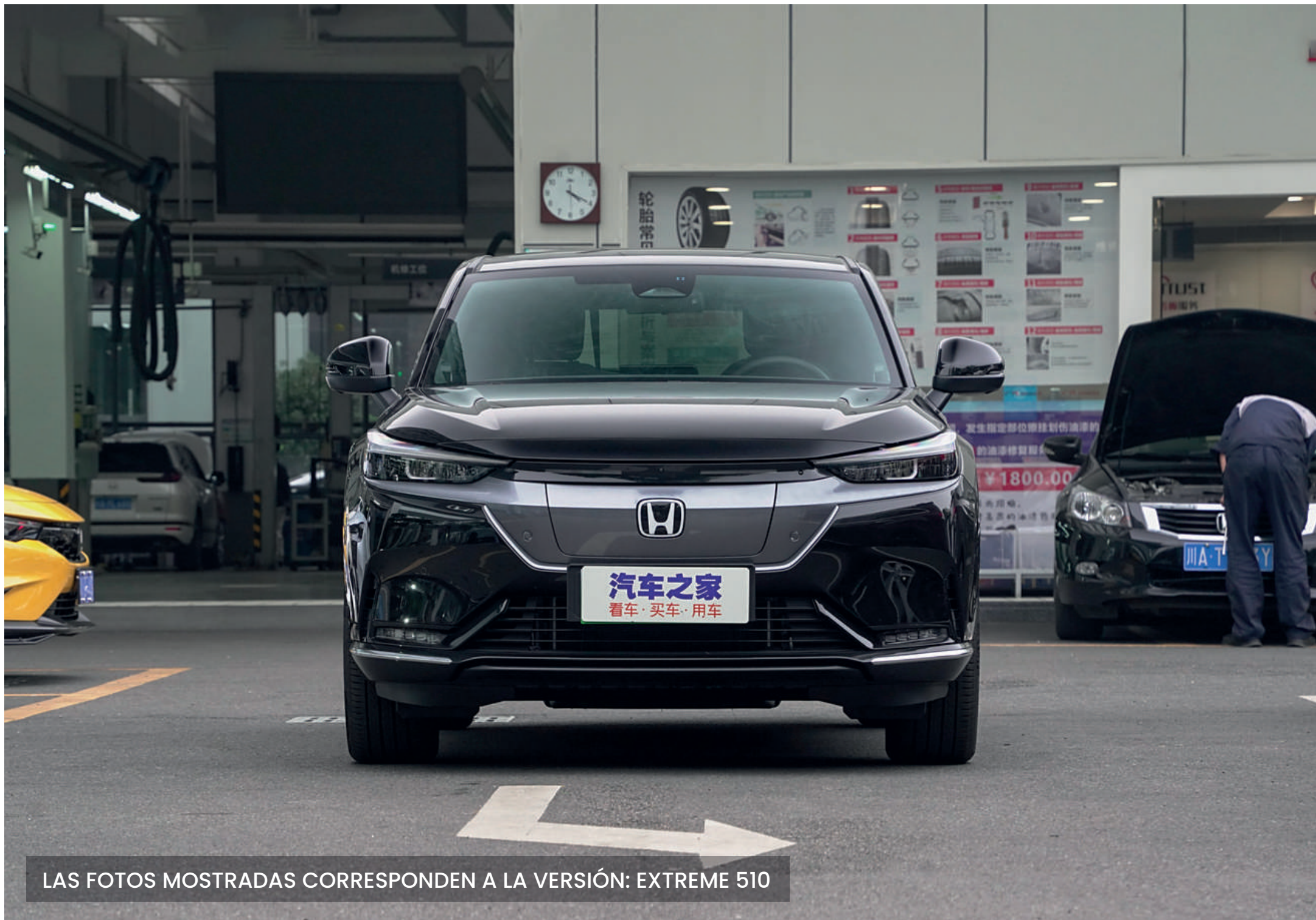
LAS FOTOS MOSTRADAS CORRESPONDEN A LA VERSIÓN: EXTREME 510