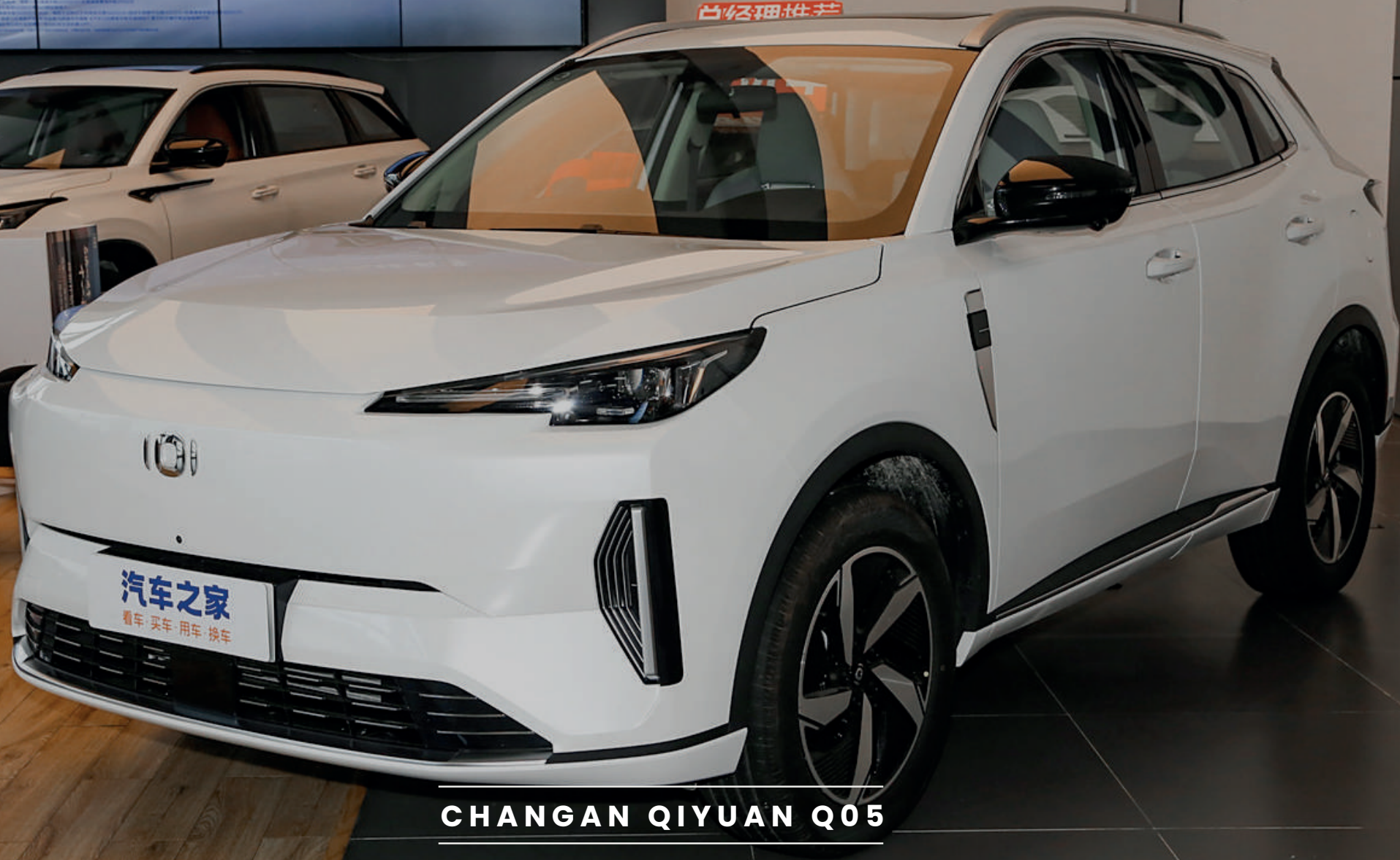
CHANGAN QIYUAN Q05