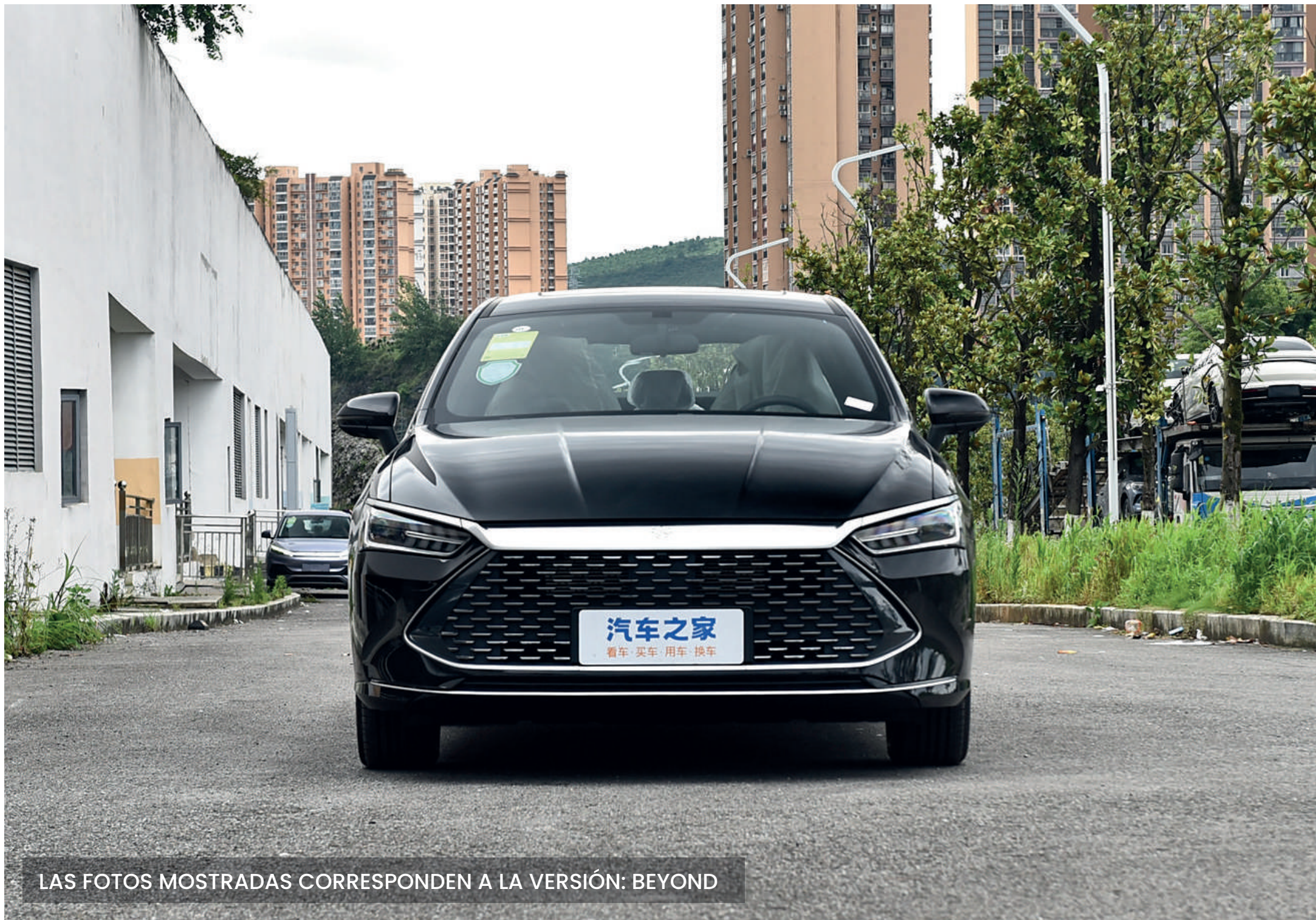
LAS FOTOS MOSTRADAS CORRESPONDEN A LA VERSIÓN: BEYOND