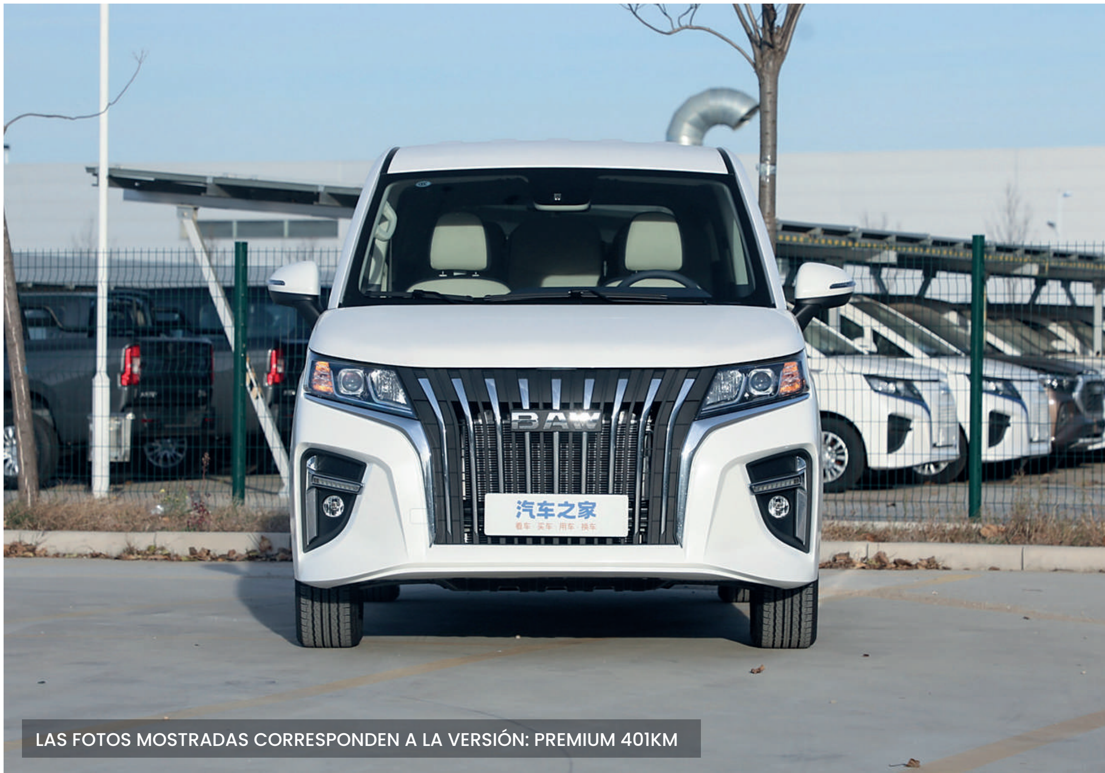
LAS FOTOS MOSTRADAS CORRESPONDEN A LA VERSIÓN: PREMIUM 401KM